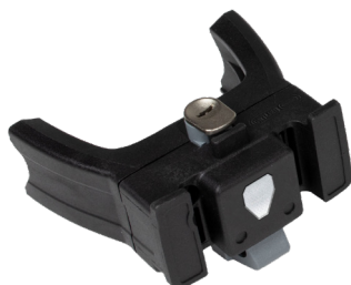
ORTLIEB Handlebar Mounting-Set E-Bike