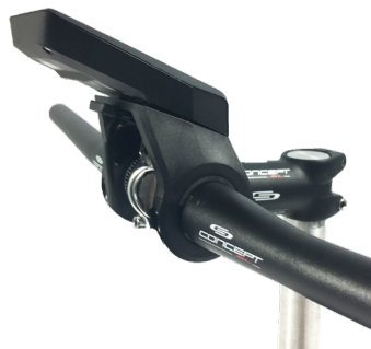
Bosch Nyon Display